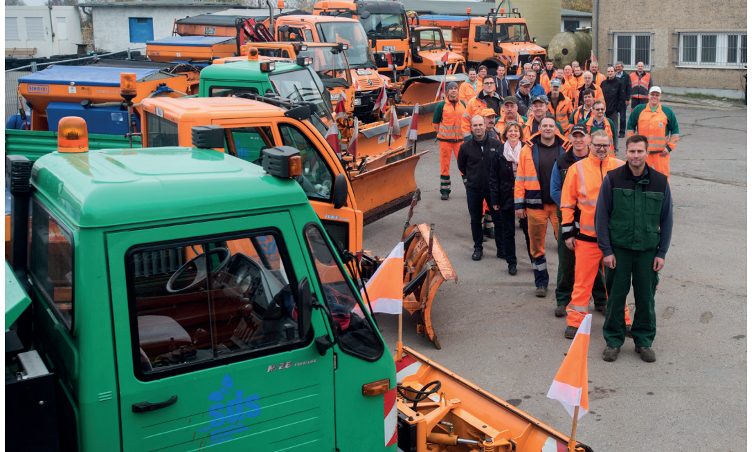
Im Winter werden rund 350 km Straße, rund 160.000 m 2 Gehwege und über 250 Haltestellen des öffentlichen Nahverkehrs bewirtschaftet.

Zusätzliche Technik soll für Radwege eingesetzt werden. Dafür konnte diese Saison bereits ein LKW eingeplant werden. Ein zweites Einsatzfahrzeug kann erst in der nächsten Saison zur Verfügung stehen. Die Vorratsmenge an Streumitteln wurde erhöht. Auch wenn in den Silos weiterhin nur 150 Tonnen Fassungsvermögen vorhanden ist, werden