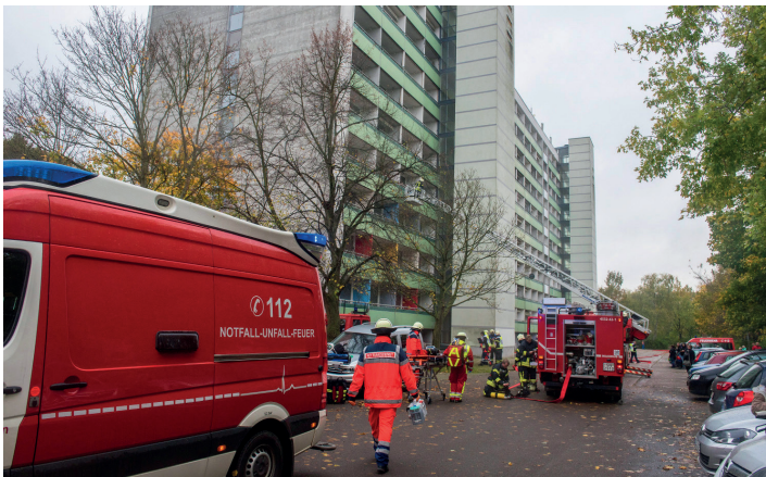
Die Berufsfeuerwehr Schwerin nutzte das freigezogene Haus in der Julius-Polentz-Straße für umfangreiche Übungseinsätze.

reiche Abrissprojekte in Lankow, auf dem Großen Dreesch und im Mueßer Holz erfolgreich umgesetzt.