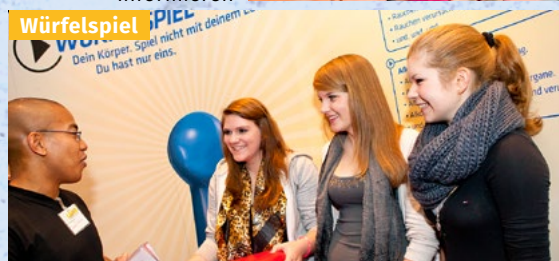
Die eigene Einstellung anderen mitteilen