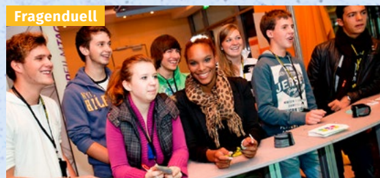
Spielend über Alltagsdrogen informieren