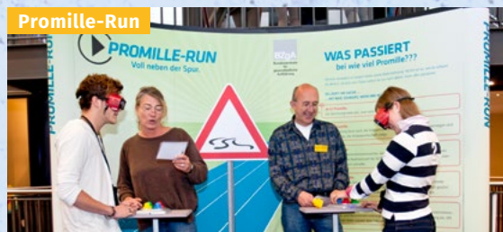
Bescheid wissen über Alkohol und Nikotin