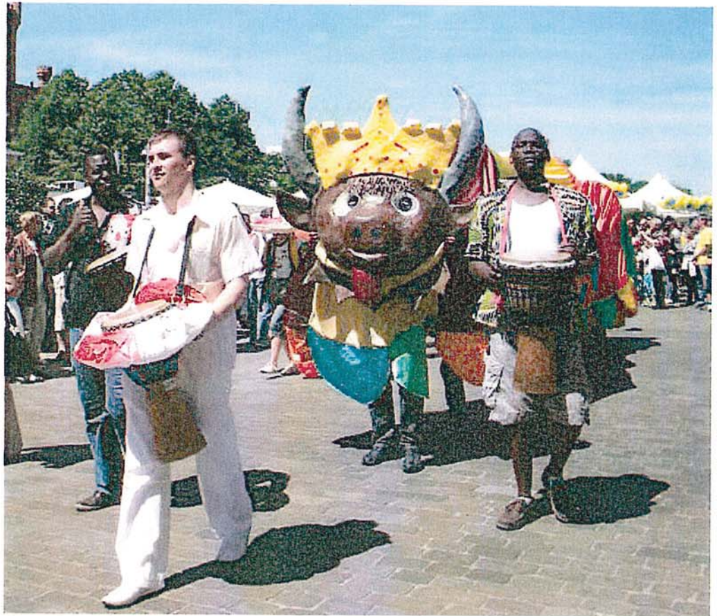
Die Parade der Kulturen startet am Sonntag, den 13. September, um 14 Uhr vor dem Rathaus.

Um 14.00 Uhr startet vom Rathaus aus die „Parade der Kulturen“, ange-