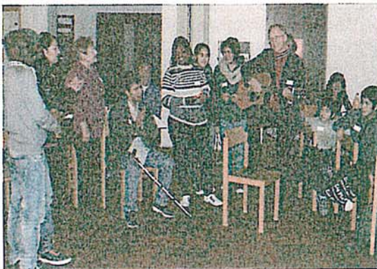
In der Petrusgemeinde wurde gemeinsam getanzt, gesungen und musiziert.

mit großer Dankbarkeit und Freude entgegen genommen. Während die Kleinen die Gaben in Empfang nahmen, markierten die Eltern auf einer großen Weltkarte ihre Heimatländer (Afghanistan, Tschetschenien, Ghana, Iran). Auch die anderen Gäste zeigten mit ihren Herkunftsländern Usbekistan, Ukraine und Polen, dass Schwerin durchaus multi-kulti ist.