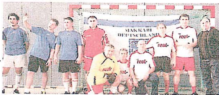
Sport verbindet. Der Verein freut sich auf neue Mitglieder.

Demnächst stehe der Besuch einer Gruppe von 26 Asylsuchenden beim Verein an. Die aus Syrien stammenden Flüchtlinge absolvieren einen Sprachkurs. „Sie kommen zu uns, um sich über die sportlichen Möglichkeiten zu informieren, die unser Verein bietet wie Fußball, Volleyball, Tischtennis und Tischhockey. Darüber hinaus haben wir Tanzkurse für Jungen und Mädchen im Alter von drei bis acht Jahren. raib