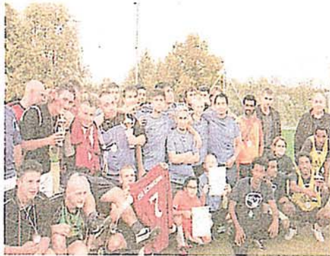
Die Mannschaften freuten sich über das gelungene Turnier.