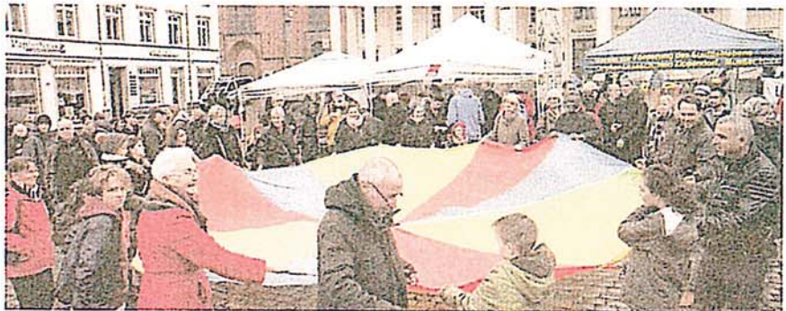
Gute Laune steckt an und inspiriert zum Mitmachen