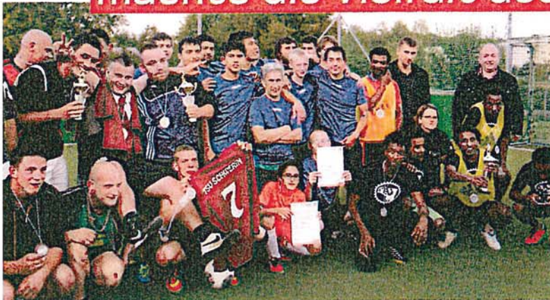
Die Mannschaften freuten sich über das gelungene Turnier

Mueßer Holz (raib). Im Rahmen der interkulturellen Wochen der Landeshauptstadt Schwerin hatte der Turn- und Sportverein Makkabi e.V. unter der Leitung