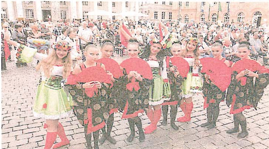
Beste Stimmung auf dem Markt: Beim „Festival der Kulturen“ sind auch in diesem Jahr Tanz- und Musikgruppen von Migrantenvereinen und einheimische Ensembles zu erleben.

Bis in den Oktober hinein bieten die Interkulturellen Wochen wieder Workshops, Sport, Musik und Diskussionen. Auf dem Programm stehen insgesamt rund 40 Veranstaltungen, darunter auch Filmvorführungen, religiöse Begegnungen und ein Afrika-Tag. Ein wichtiger Höhepunkt ist die Verleihung des Annette-Küppinger-Preises für Integration und Menschlichkeit auf der traditionellen