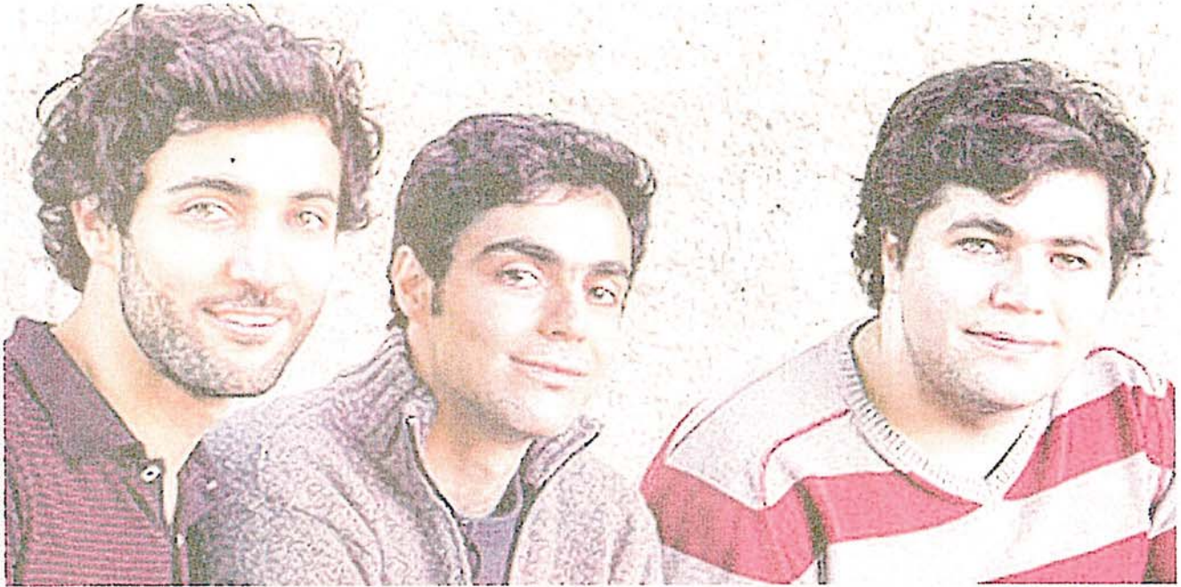
Die drei Brüder sollten als Kinder abgeschoben werden, schafften es jedoch an Elite-Unis.