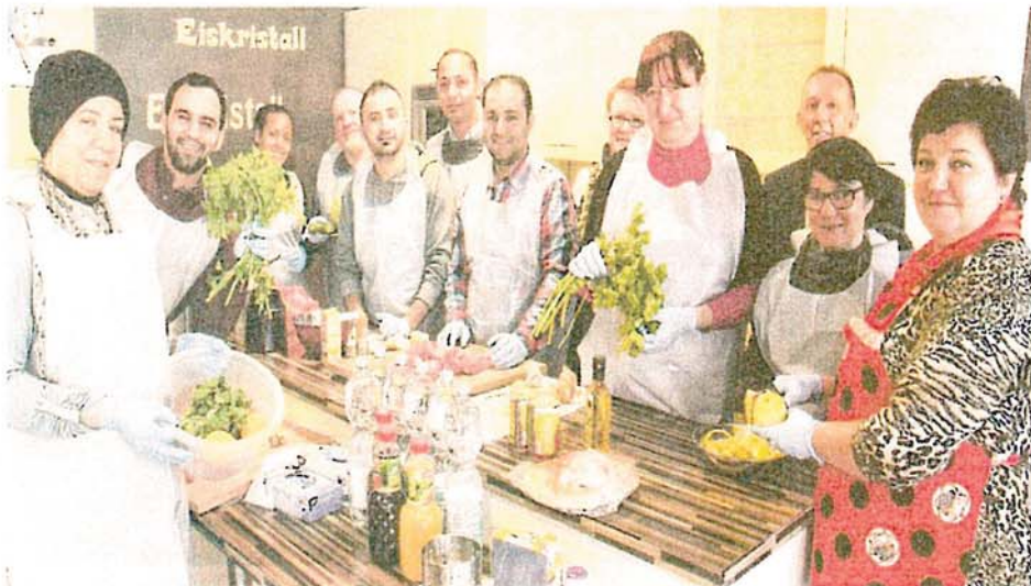
Salat, Apfelkuchen und Köfte stehen auf dem Speiseplan. Viel wichtiger als die Zubereitung ist beim Kochprojekt von Platten-Verein und Bilsse-Institut aber das Reden.

Dieses gemeinsame Kochen im Stadtteiltreff „Eiskristall“ dauert mehrere Stunden. Wenn gegessen wird, dann erzählen die Neu- und Alt-Schweriner über das, was sie gerade beschäftigt. Saleh Hamid zum Bei-