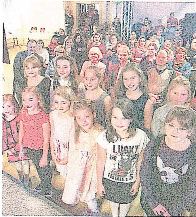
Die jungen Talente des Chores „Kinderland“ sangen in drei verschiedenen Sprachen.