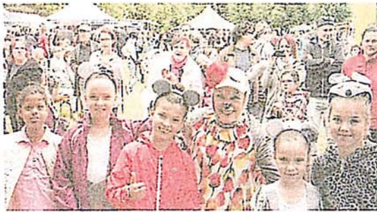
Keine Feier ohne die Stadtteilmaus: Muezi war auch beim Fest am Sonnabend wieder mit von der Partie.

SCHWERIN Gefeiert wurde am Sonnabend wieder am Fu- ße des Fernsehturms, aber das Fest für die Bewohner der Stadtteile Großer Dreesch, Neu Zippendorf und Mueßer Holz hatte in diesem Jahr doch einen besonderen Ak-