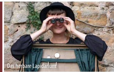
Das herbare Lapidarium!