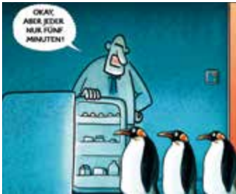
Markus Grolik: 5 Minuten

Ausstellung zum 20. Deutschen Karikaturenpreis