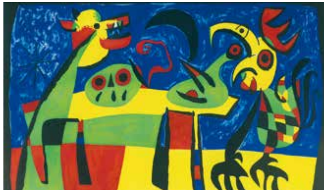
Joan Miró: Der hund, der den Mond anbellt 1952, Lithografie