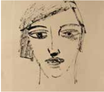
Christine Stäps: Ohne Titel 2016, Feder und Tusche