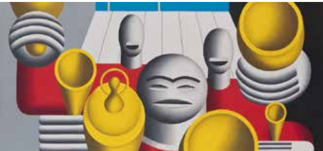
Hans Ticha: Die Sieger 1984, Öl auf Leinwand