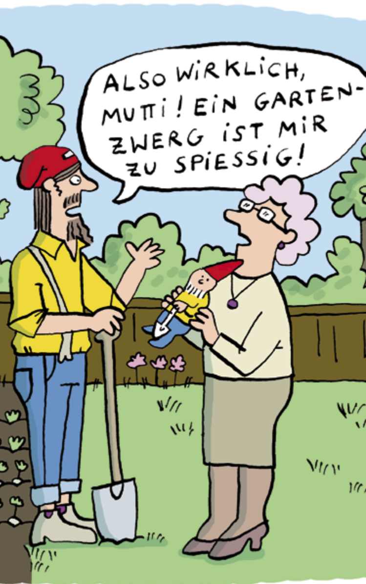
Bettina Schipping: Hipster im Schrebergarten (Ausschnitt) Verhissage am 21.02 © Bettina Schipping, Deutscher Karikaturenpreis 2018