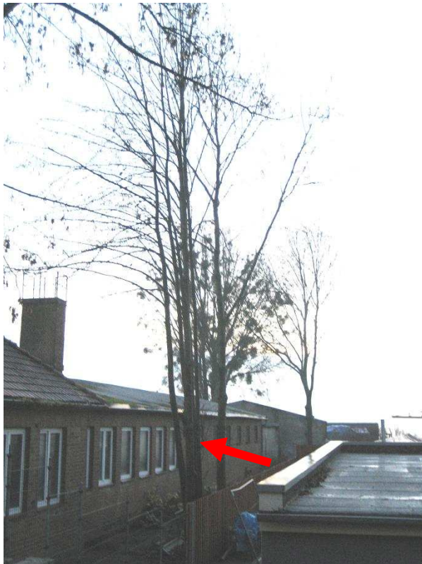
Nr. 9 mehrstämmig