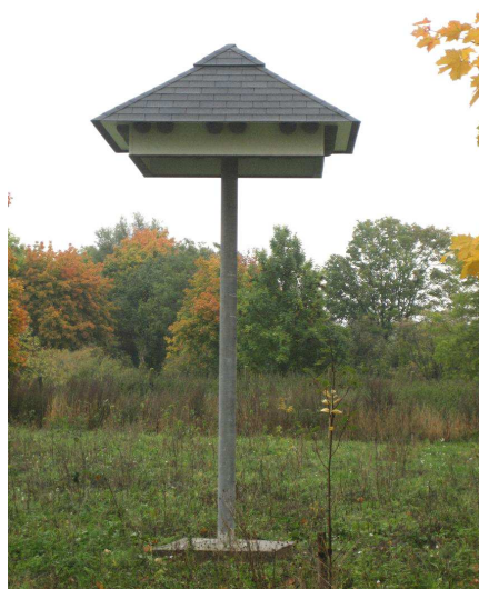
Abb. 2 Schnalbenturm

Durch den Abriss des Bootsschuppens im Süden des Geltungsbereichs gehen Brutplätze der Rauchschnalbe verloren. Dieser Verlust wird durch die Aufstellung eines Schnalbenturms (Abb. 2) im Süden des Geltungsbereichs funktional ausgeglichen. Die Herstellung des Schnalbenturms hat nach Abriss des südlichen Bootsschuppens im Geltungsbereich vor Beginn der nächsten Brutzeit Anfang März zu erfolgen. Die Kontinuität der Brutstätte ist gewahrt.