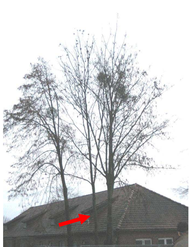
Nr. 10 mehrstämmig