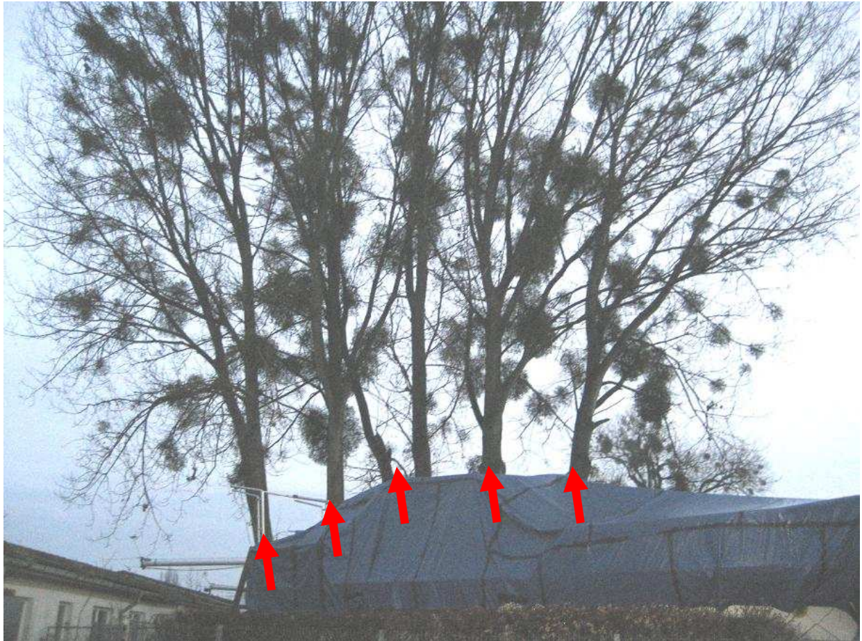
Nr. 3 bis 7 von rechts nach links; Nr. 5 hat starken Seitenast