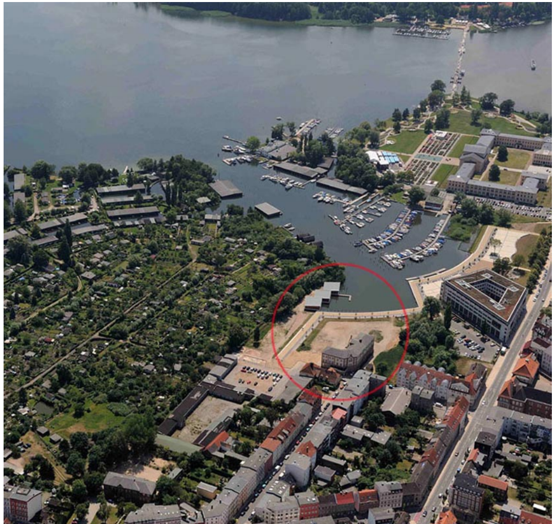
Markierte Kreisfläche zeigt die Grundstücke Amtsstraße 21-23.

Über eine Machbarkeitsstudie als geeigneter Standort ausgewiesen