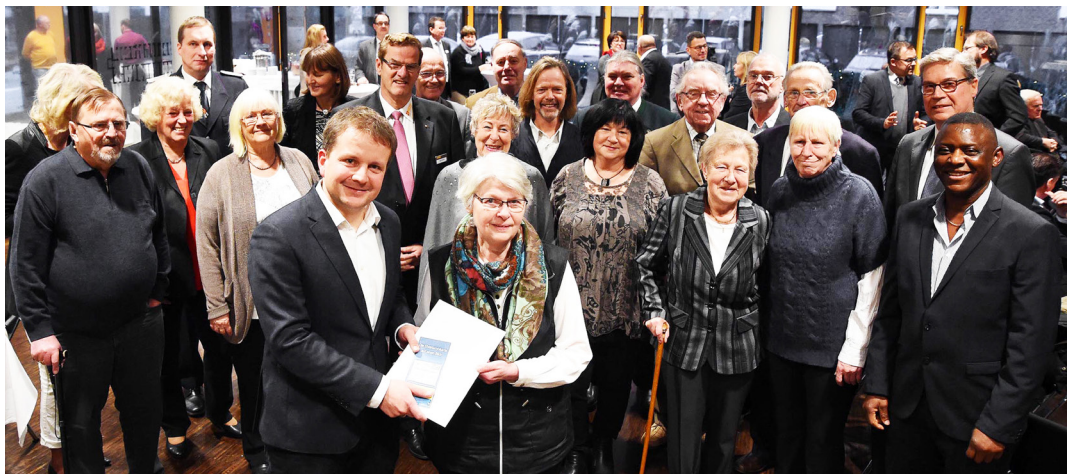
Stadt sagt Danke mit Ehrenamts- und Petermännchenkarte.