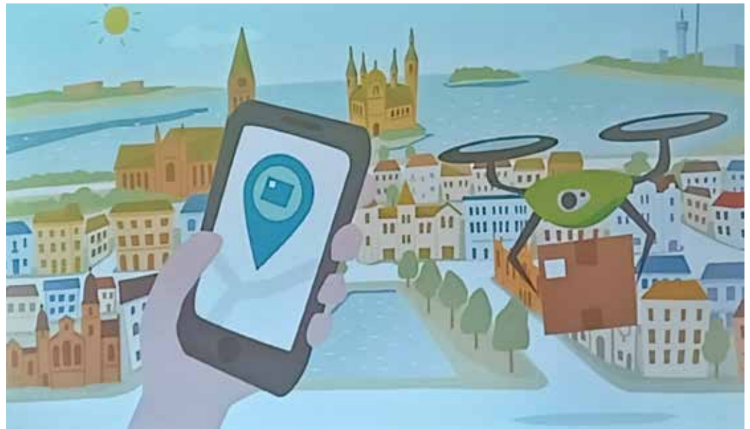
Wie werden Lieferungen in der Zukunft zugestellt?

„Mit dem Online-Handel hat der Lieferverkehr sich durch Kurier- und Paketdienste vervielfacht und schafft zusätzliche Probleme, die