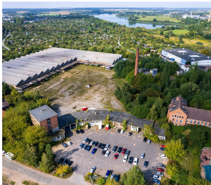
Das KIW Vorwärts-Gelände ist zusammen mit dem alten Güterbahnhof eine zentrale Potenzialfläche für den innerstädtischen Wohnungsbau in Schwerin.

Den räumlichen Schwerpunkt der Landesgartenschau sollen nämlich das frühere KIW „Vorwärts“-Gelände und der alte Güterbahnhof bilden. Die aneinander angrenzenden Areale mit einer Fläche von insgesamt 39 Hektar gelten in der Landeshauptstadt trotz ihrer großen Altlasten seit langem als zentrale Potenzialflächen für den innerstädtischen Wohnungsbau. Doch die Sanierung, Neuordnung und Erschließung des Geländes ist teuer. Die Idee des Vereins Pro Schwerin, das Gelände mit einer Landesgartenschau für den Bau bezahlbarer innenstadtnaher Wohnungen vorzubereiten, konnte daher die Entscheidungsträger in der Stadtverwaltung und beim Land schnell überzeugen. „Es geht nicht um eine Blümchenschau, sondern um die weitere Stadtentwicklung, die uns sehr am Herzen liegt. Wir haben mit der Landesgartenschau die Chance, einen neuen Stadtteil auf überwiegend städtischem Grund zu errichten, bezahlbaren Wohnraum für Familien in Innenstadtnähe zu schaffen und neue Wegebeziehungen, vor allem für den Radverkehr, herzustellen. Außerdem steigert eine Landesgartenschau die Bekanntheit Schwerins und unseres Weltkulturerbes. Wir freuen uns, dass unser ehrenamtliches Engagement so großen Widerhall findet. So macht Ehrenamt richtig Spaß“, sagt der Vorsitzende des Vereins Pro Schwerin Werner Hinz. Mit der Schwimmenden Wiese am Bertha-Klingberg-Platz und dem ehemaligen Küchengarten am Franzosenweg sollen zwei