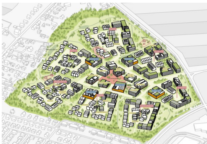
In Warnitz soll ein attraktives, zukunftsweisendes Wohnquartier mit rund 1000 Wohnungseinheiten entstehen. © Büro MOSAIK

Als eine der wenigen noch verfügbaren Potenzialflächen für weiteren Wohnungsbau am Stadtrand ist das Warnitzer Feld seit 2020 Gegenstand städtebaulicher Planungen. In 5,6 km Entfernung zum Stadtzentrum soll am nordwestlichen Stadtrand Schwerins im Ortsteil Warnitz auf einer vormals landwirtschaftlich genutzten Fläche ein attraktives, zukunftsgerichtetes Wohnquartier mit rund 1000 Wohnungseinheiten entstehen. Die Planungen waren zwischenzeitlich unterbrochen und wurden auf Beschluss der Stadtvertretung nach intensiven politischen Diskussionen wieder aufgenommen. Nun liegt der Entwurf des Bebauungsplans für das künftige Wohnquartier vor und wird in den nächsten Sitzungen der städtischen Gremien diskutiert. Noch vor der Sommerpause wird der Veröffentlichungsbeschluss des Hauptausschusses erwartet,