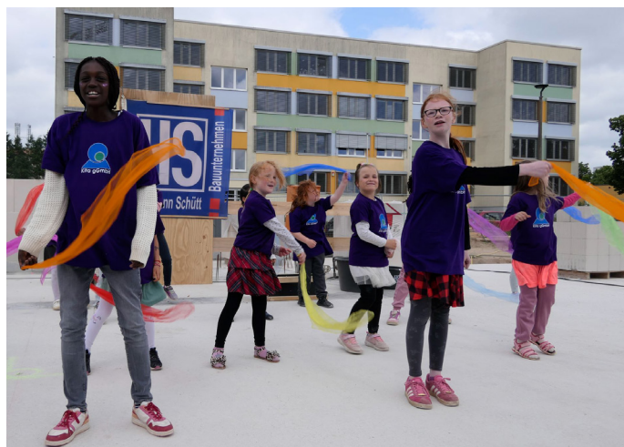
Mit einem Tanz haben Kinder der Grundschule Mueßer Berg die Grundsteinlegung des neuen Hortes Future Kids gefeiert. Das Gebäude soll Ende 2027 fertiggestellt sein.

räumlichkeiten von Future Kids innerhalb der Grundschule. Ursprünglich für eine Dreizügigkeit einschließlich Hort umfassend saniert, umfasst diese Grundschule inzwischen vier Parallelklassen und deckt ab dem Schuljahr 2026/2027 außerdem den Förderbereich Lernen für alle vier Jahrgangsstufen ab. Der Neubau wird nachzeitigem Stand ca. 9,5 Millionen Euro kosten. Die förderfähigen Kosten in Höhe von 8,4 Millionen Euro werden zu 100 Prozent über Städtebaufördermittel finanziert. Das 2-stöckige freistehende Gebäude entsteht auf einer Grundstücksfläche von 5.488 m 2 . Im ersten und zweiten Obergeschoss sind unter anderem Werkstatt-, Sport- und Mehrzweckräume sowie Musik-, Power- und Rückzugsräume geplant. Im Obergeschoss sind unter anderem Räume zum Bauen, Forschen und kreativen Gestalten vorgesehen. Die Räumlichkeiten sollen in Laut-Leise-Bereiche gegliedert werden, um eine flexible Raumnutzung zu ermöglichen. Auch die Außenanlagen werden gestaltet: Die