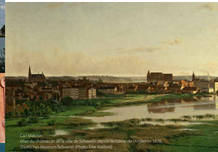
Carl Malchin «Vue du château et de la ville de Schwerin depuis la colline de l'Artillerie» 1876, Staatliches Museum Schwerin

L'ensemble de la résidence de Schwerin représente le parfait exemple du siège d'une cour princière du XIXe s. dans le style de l'historicisme romantique. Il a été créé entre 1825 et 1883 sous les règnes des grands-ducs Friedrich Franz Ier, Paul Friedrich et Friedrich Franz II de Mecklembourg-Schwerin. L'ensemble de la résidence a été étendu à la ville avec les bâtiments de l'administration de la cour et de l'État, comme le bâtiment du Conseil, le théâtre et le musée destiné aux collections d'art princières à l'Alte Garten. De même, la cathédrale et la Schelfkirche avec leurs tombeaux ducaux, l'église St-Paul, le complexe de casernes protégeant la résidence, le Neustädtische Palais et les bâtiments fonctionnels, comme l'écurie ou la blanchisserie de la cour, appartiennent à cet ensemble.