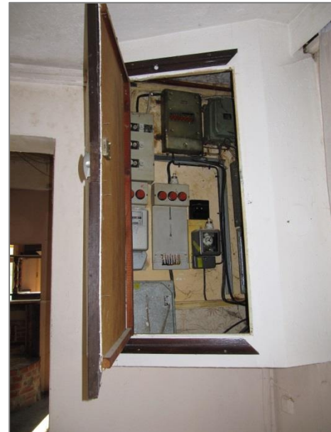
Stromverteileranlage alter Zustand