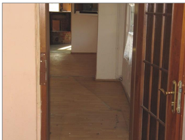
Blick vom „Barbereich“ bis zum Gaststättenraum