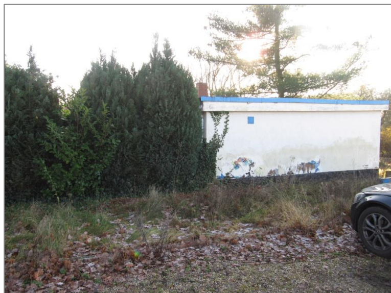
Nordwestansicht, Ansicht entlang der Straße