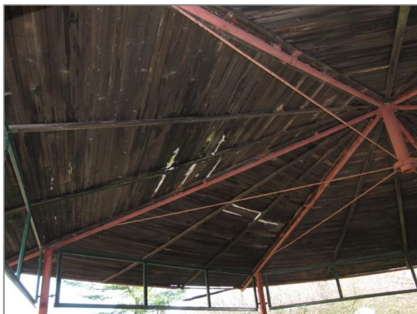
Pavillon - Schwamm am Holzdach