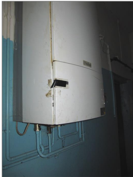
Gastherme – sehr alt