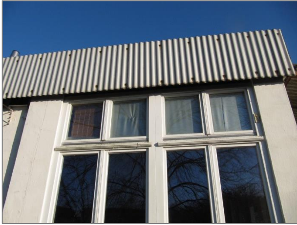
Fenster vom Gastraum