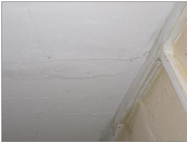
Unebenheiten, Risse Elektroleitungen auf Putz bzw. in Kabel- schächten