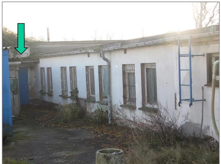
Ostansicht, großflächige Putzschäden im Sockelbereich