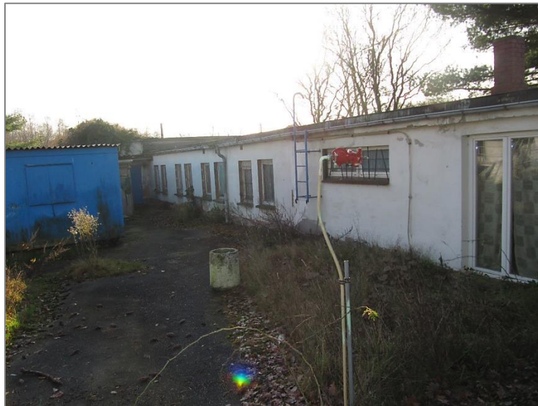
Hofbereich z.T. befestigt