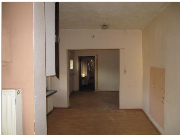
Gastraum (siehe oben andere Perspektive)