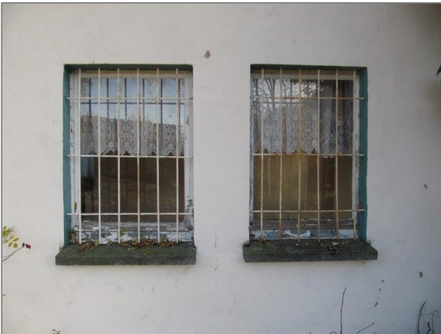
Vergitterte Fenster – alte nicht erneuerte Fenster noch vorhanden