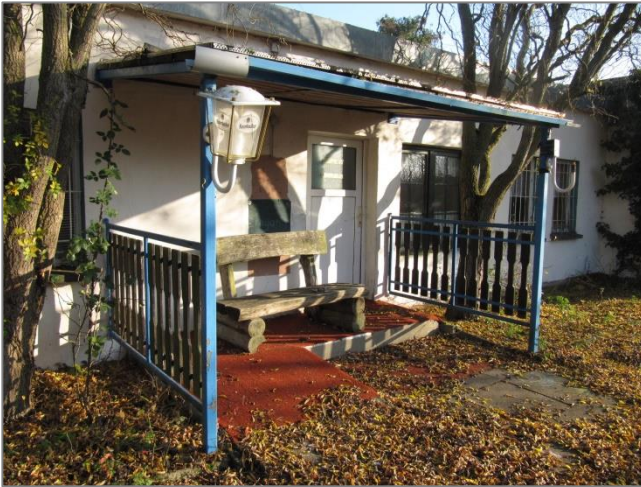
Eingang mit Rampe