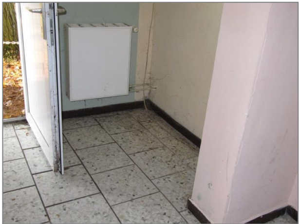
Eingangsbereich / Garderobenraum