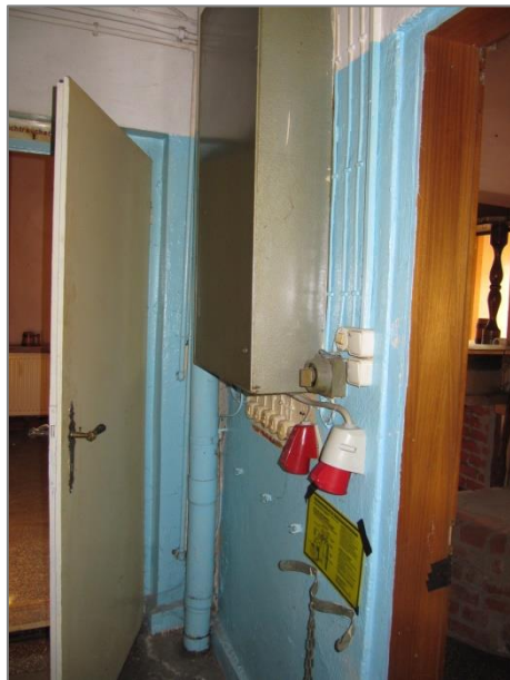
Stromverteilerkasten mit Starkstrom