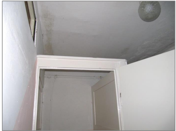
alte Feuchtigkeitsschäden an der Decke und auch im Wandbereich