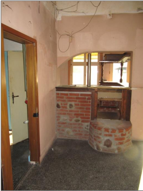
Links: Zugang Küchen- und Personalbereich