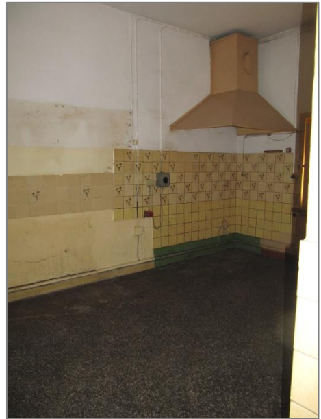
Küche mit Abzug