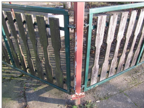
Zaun entlang der Terrassen