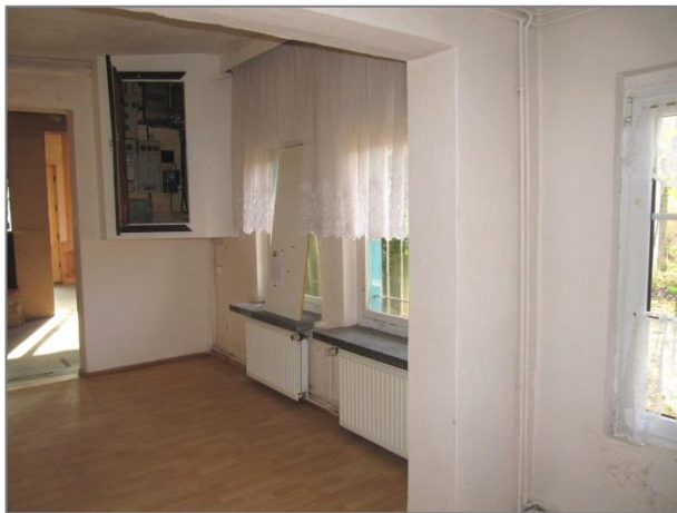
Gastraum – Fußboden Laminat