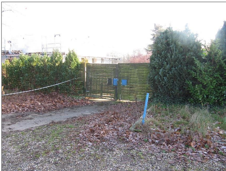
Zufahrt zum Hof