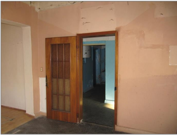
Zugang Küchen- und Personalbereich