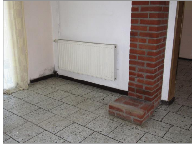
Standort Kaminofen - Schornstein