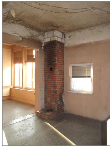
abgehängte Decke entfernt