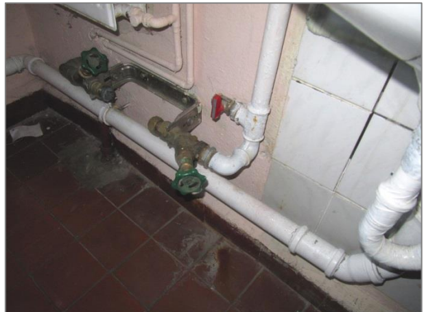
Leitungen auf Putz, alter Zustand