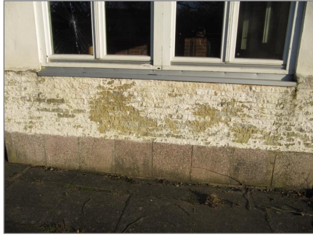
Wandverkleidung wurde entfernt