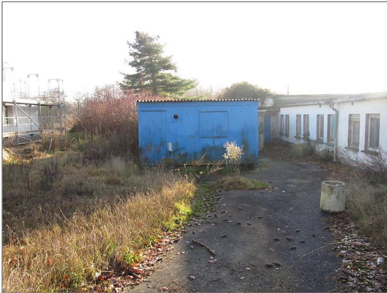
„Kiosk“ als Nebengebäude in einfacher Bauweise