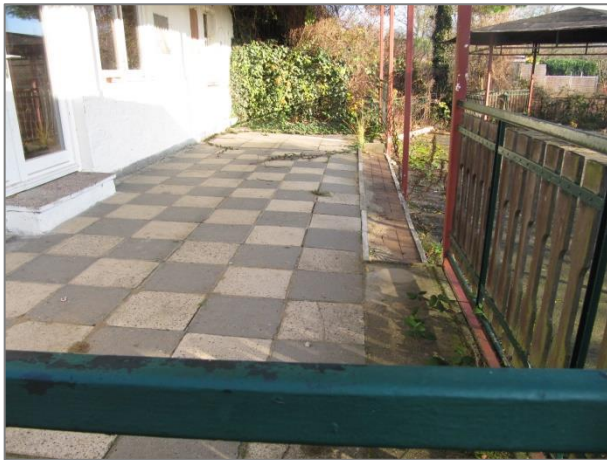
Terrasse mit Überdachung