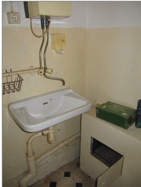
Personal – WC-Bereich