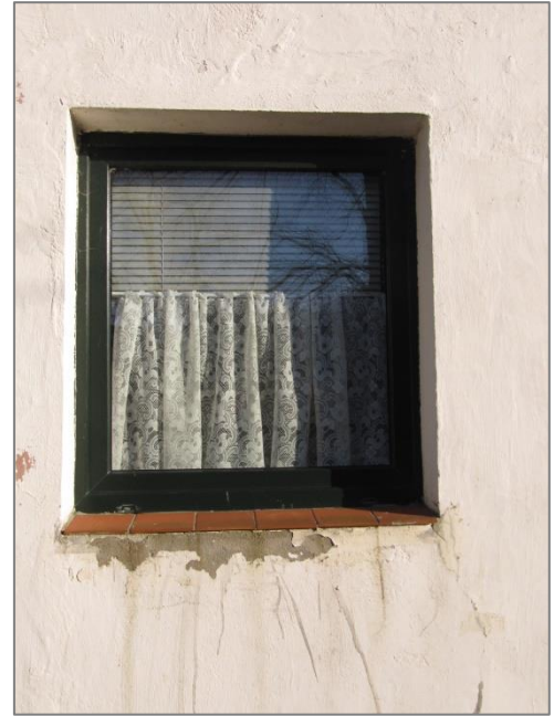
neues Fenster nach 1990