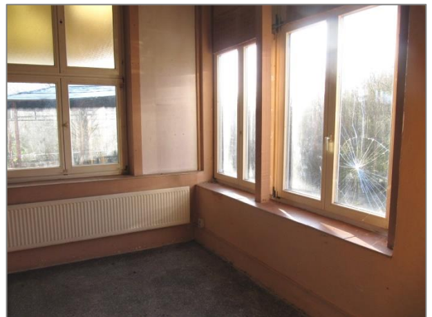
Gastraum mit Theke