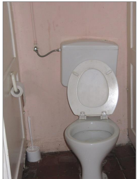
einfachste Ausstattung der Toilettenräume